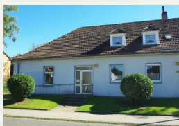
Melancthon- haus Emscherbruch 60