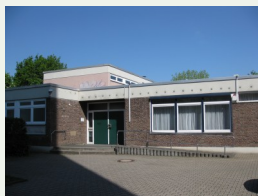
Lutherhaus (Gemeindebüro) Friedhofstr. 2a