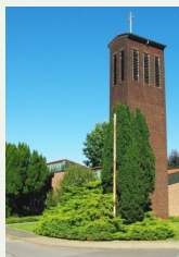
Erlöserkirche Freiheitstr. 18