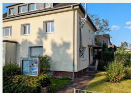
Gemeinderäume Lambertstr. 24