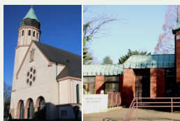
Kirche & Pfarrheim St. Josef Lessingstr. 22