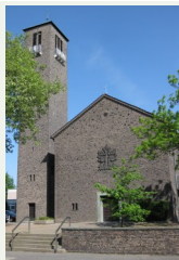
Christuskirche Ickerner Str. 51